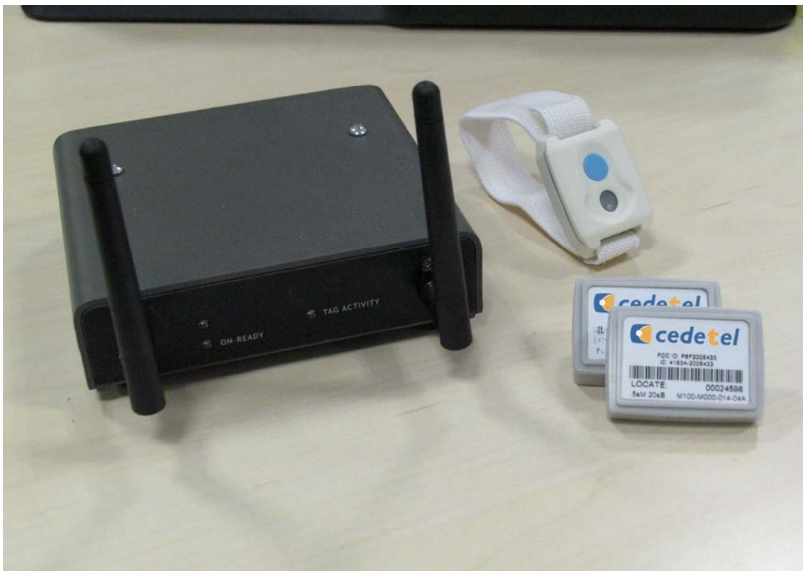
Lector de señales, etiquetas en formato pulsera para personas y encapsulados para activos

Todo en WiLocT son piezas que pueden separarse y que presentan un comportamiento autónomo. El único dispositivo de control necesario en cada centro es un servidor donde se instala el middleware, que es quien se comunica con la infraestructura local desplegada. Todos los demás elementos pueden no estar en el hospital, e incluso una red de hospitales podría compartir el resto de infraestructura, por ejemplo el servidor que se encarga de ejecutar el motor de localización. El sistema garantiza la escalabilidad de los proyectos convirtiendo a WiLocT en una inversión segura y fiable.