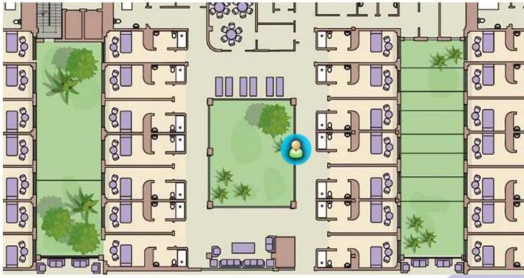
Gestión de errantes en una residencia

En dicho centro se pretende testear el sistema de control de errantes y el sistema de localización, tanto el de precisión como el zonal. Para el funcionamiento de estos sistemas es necesario entregar a los pacientes unas etiquetas (tags) al ser dados de alta o al entrar al centro de día. Las etiquetas presentarán dos formatos diferentes; el primero de ellos en forma de colgante con una foto del paciente, y el segundo, que se reparte a los enfermos en fases de la enfermedad más pronunciadas, se coloca en la ropa de los mismos, de tal forma que estos no se percaten de su presencia, pues pueden ser reacios a este tipo de elementos desconocidos para ellos.