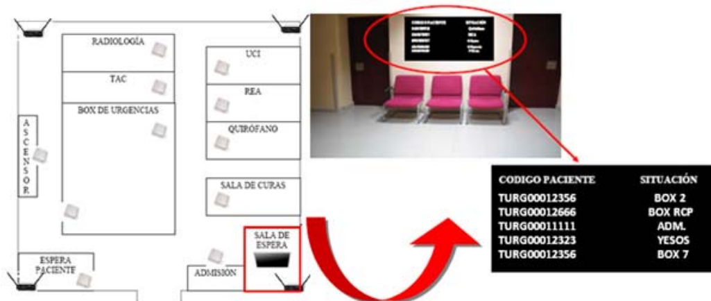
Panel informativo ubicado en la sala de espera

Por otro lado, en todo hospital resulta crítica la necesidad de ofrecer tanto a los familiares en las salas de espera, como al propio personal sanitario del centro, información precisa sobre la situación o proceso sanitario, en que se encuentra un determinado paciente.